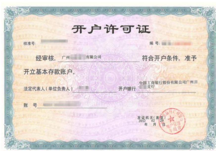
开户许可证示例图